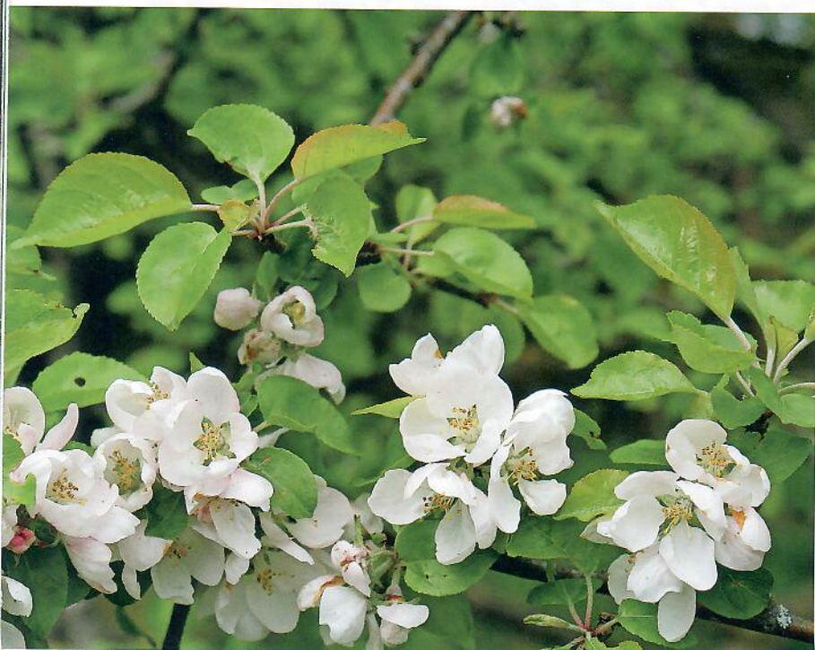
Blommorna på 'Sigtuna Sur'. Notera även de röda, håriga bladskäften.

Läs historien om ett äppelträd sprunget ur en kärna som såddes i slutet av 1700-talet och som fortfarande växer på samma plats strax norr om Sigtuna. Med denna artikel är Hemträdgården med och namnger sorten till 'Sigtuna Sur'. På detta sätt kan denna härdiga sort, som överlevt så många vintrar och vuxit till sig så att trädet i dag hör till de största äppelträden i landet, sparas, förökas och på så sätt få finnas kvar.