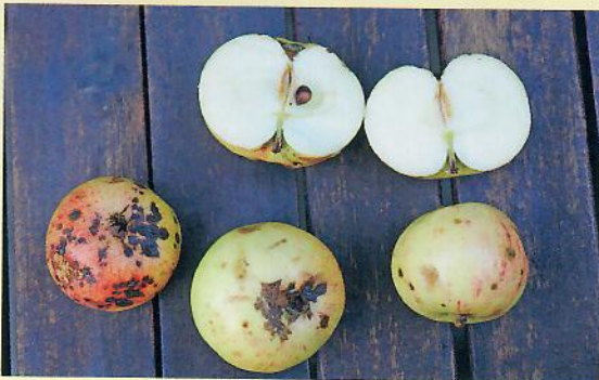
Frukt av 'Sigtuna Sur'. Tyvärr var alla angripna av äppleskorv vid fotograferingstillfället.