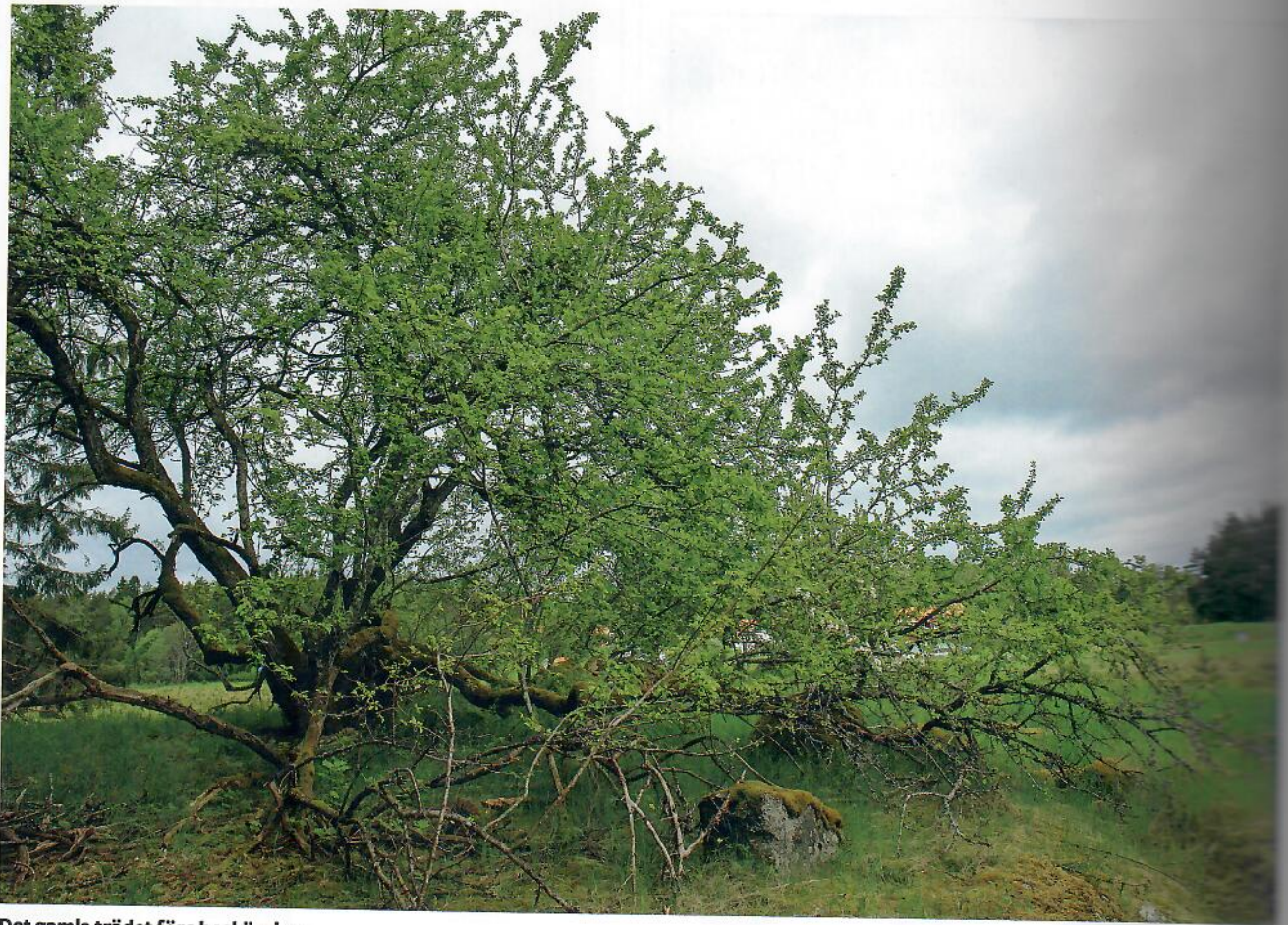
Det gamla trädet före beskärning.

»Stammen är 400 cm i omkrets och bedöms vara mellan 160 och 200 år.«