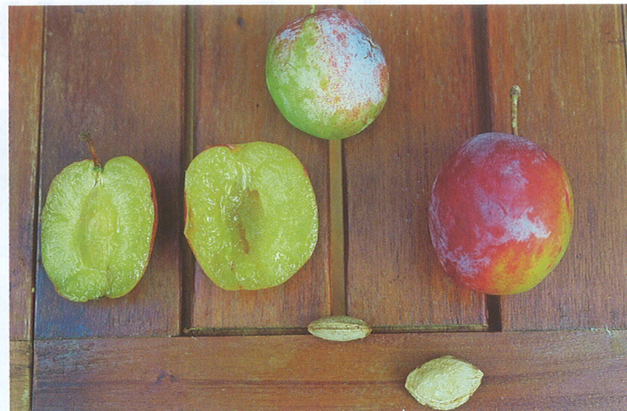
Närbild på plommonet från Hagbyholm, här ituskuret. Ribborna i trädgårdsbordet är exakt 50 mm breda. Samma bord till höger.