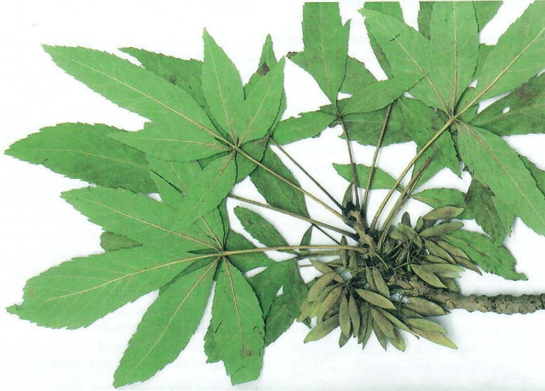
Herbariebelägg för fingerask Fraxinus excelsior f. digitata Gotland, Visby, DBW:s botaniska trädgård den 24 augusti 2003 (UPS holotyp).

Visborgsgatan 43. Han ger här några glimtar av ett långt och lärorikt samarbete med Jacob Hansson.